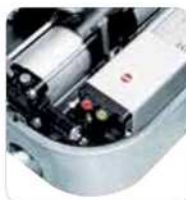
Particulares de los registros de regulación de la fuerza