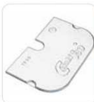
Optional cubierta en acero inoxidable, da colocar encima a la cubierta